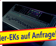
Qu-7 / Qu-7D

Die neue Qu-Series gibt es in 3 Baugrößen und als Danteversion