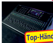
Qu-6 / Qu-6D