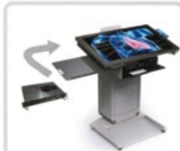
Integrierter High-Performance PC mit Multi-Touch Monitor