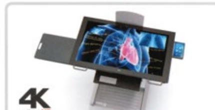
42" UHD Display mit sensiblen 10 Punkte Touch