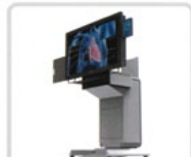
Monitor 90° schwenkbar