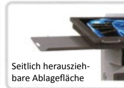
Seitlich herausziehbare Ablagefläche